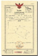
โฉนดที่ดิน