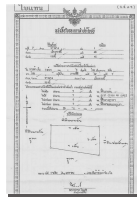
น.ส. 3/น.ส. 3ก

การสัมภาษณ์จะมีขั้นตอนที่ให้เกษตรกรชี้แปลงที่ดินตนเองในแผนที่ขนาดใหญ่และให้ข้อมูลที่เกี่ยวข้องกับผลผลิตทางการเกษตรการใช้น้ำเพื่อการเพาะปลูกตลอดจนปัญหาทางการเกษตรที่พบในแปลงที่ดินเพิ่มเติม